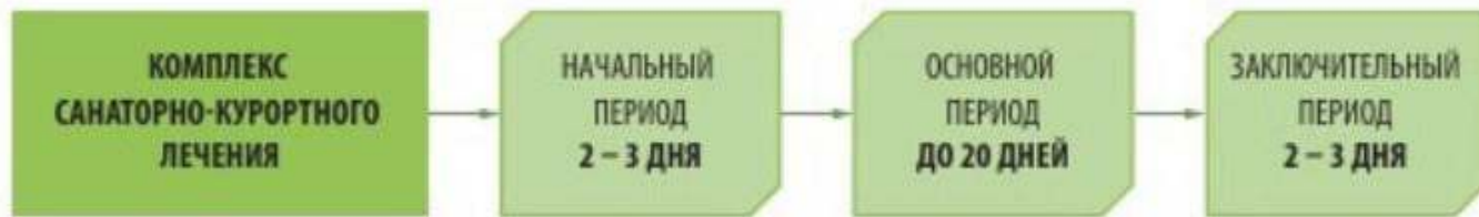
Рис. 2. Этапы санаторно-курортного лечения

Лечебно-оздоровительный туризм является более широким понятием, которое включает два компонента- лечение и оздоровление, определяющие такие его разновидности, как медицинский, санаторно-курортный и оздоровительный туризм